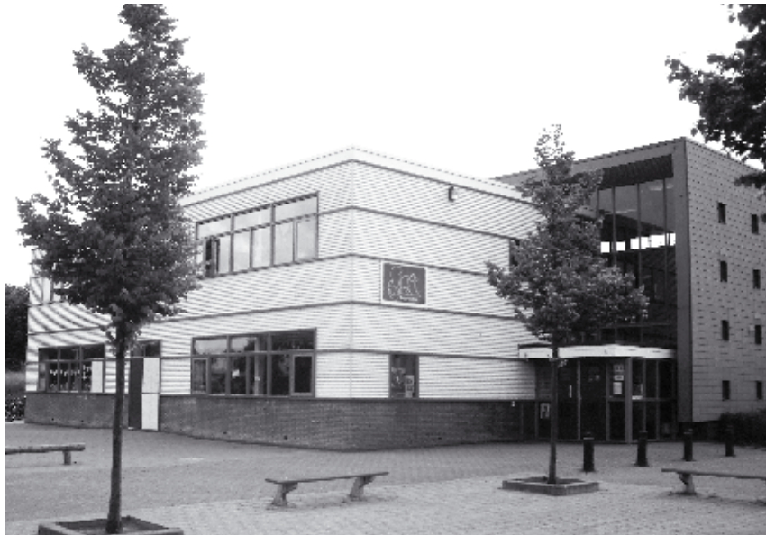
Locatie 'Johanna Naber'

's Middags ligt de nadruk op de creatieve en wereldoriënterende vakken. Natuurlijk worden kringactiviteiten gehouden en werken de kinderen soms in tweetallen of in groepjes aan opdrachten. Aan de lesmethoden voor groep 1 tot en met 8 zijn computerprogramma's verbonden.