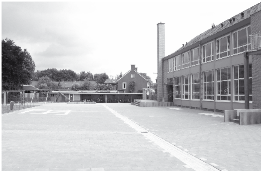
Locatie 'Jan van Riebeeck'

Het gebouw aan het Johanna Naberpad is een modern en praktisch gebouw met een ruime gemeenschappelijke ruimte, een computer-ruimte en verschillende flexruimten. Deze ruimten zijn bedoeld voor de intern begeleider, de remedial teacher, de logopediste en de schoolarts. Kinderen kunnen daarvan gebruik maken om in kleine groepjes het een en ander uit te werken en het zijn ideale plekken om in alle rust met ouders te praten, een onderzoek of test uit te voeren of een overleg te hebben enz. Het gebouw aan de Jan van Riebeeckstraat stamt nog uit de jaren 50. In het schooljaar 2007-2008 is deze locatie in zijn geheel gemoderniseerd. In het schooljaar 2008-2009 hebben we intrek genomen in de 'Brede School' aan de Zijderupsvlinderlaan. Dit is een modern en multifunctioneel gebouw waarin de meest moderne voorzieningen aanwezig zijn.